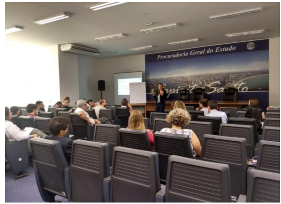
1ª Reunião do GT “Baixo Doce”