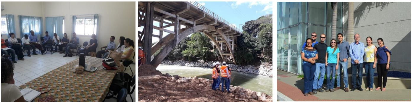
Vistoria de Reconhecimento da área impactada do ES pela CT-GRSA e CT-Infra.

Para auxiliar a compreensão dos contextos em que essas demandas se encontravam, possibilitando uma gestão mais eficiente e rápida dos problemas e das propostas de soluções apresentadas no âmbito de cada Câmara Técnica, foi solicitado o custeio por parte da Fundação Renova para a realização de uma vistoria técnica no Estado do Espírito Santo (imagens 3, 4 e 5).