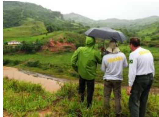
Vistoria para análise do Trecho 9.