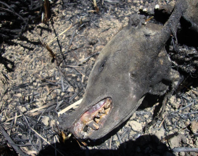
Nasua nasua .