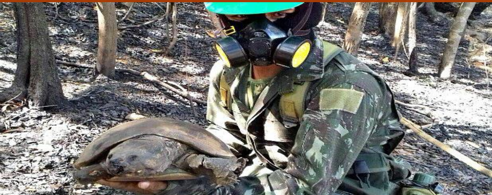
Peltochephalus dumerilianus .