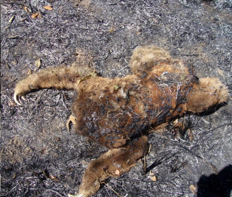
B. torquatus .